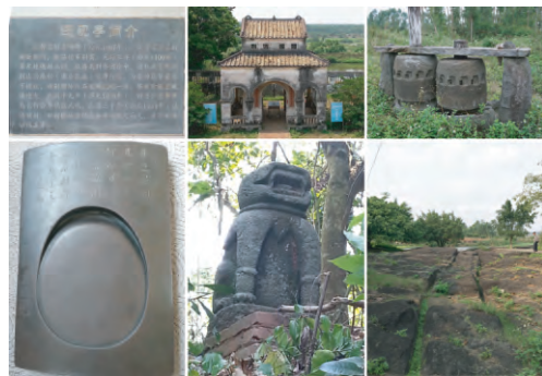
图3 苏东坡与双村古道文化史迹

传统村落不少于2000个。现已被评为中国传统村落160个,省级传统村落186个;中国历史文化名村22个,省级历史文化名村56个。这些村落大都位于古道沿线并呈现出岭南民系文化特色,如韶关市南雄市珠玑巷村、新田村,始兴县黄塘村,仁化县石塘村,曲江苏拱村;河源市和平县林寨村;潮州市潮安区龙湖古寨,饶平县钱塘村;广州市从化区钱岗村,增城区瓜岭村;佛山市南海区松塘村、顺德区金碧村;江门市台山市梅家大院;湛江市雷州市邦塘村,徐闻县二桥村,遂溪县苏二村、调丰村和双村等;梅州市梅县区玉水村,大埔县车龙村,平远县石角村等等。这些古村内大都还有古关、古堡、古城、古寺、古庙、古港、古渡、古桥、古井、古树、古祠、古屋、古陂、土楼、围楼、碉楼、骑楼、围龙屋、侨批、银信等凸显地方特色的文化资源,展现了沿古道迁徙跋涉的人们稍事安顿,即相址择地、掘井植树、建屋修桥,巧展匠艺,精益求精。立祠设塾、怀古追宗、结庐而聚、耕读传家,营造了美丽诗意的栖居,繁衍生息形成村落(图3)。这些村落正是该地区文化发展的见证,体现了多元文化交汇融合的特征,具有极高的历史价值、社会价值、科学价值和艺术价值。其中许多村落与历史上重大事件和历史名人有关,如苏东坡曾到访过苏拱村、两次到访苏二村,还赠墨砚给双村,并流传还砚的佳话典故,激励后人 [8] 。