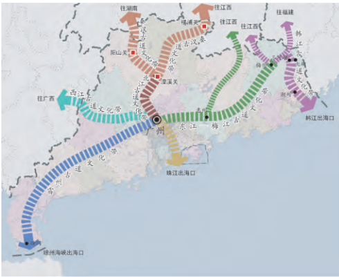
图4 南粤古道文化带

经济发展的动力 [3] 。绿道正是康体休闲生活的场所、城乡互联的纽带、现代文明的展示,已成为人们生活的空间化产品 [9] 。借鉴欧美文化线路的遗产保护与活用经验,与古道古村联动,为其注入文化内容,必将产生恒久的价值。首先将村落作为文化遗产线路空间构成的核心要素节点;二是将古道和绿道作为串联节点的线性(带状)整体性空间廊道。强调空间、时间和文化因素的关联,发挥线状各个节点共同构成文化功能和价值,以及对当今社会经济、文化传承和可持续发展产生积极影响 [10] 。